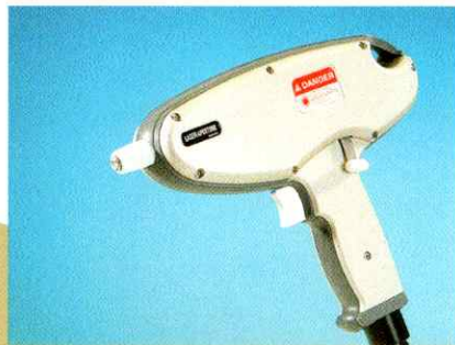
Cabezal de tratamiento Nd:YAG mejorado