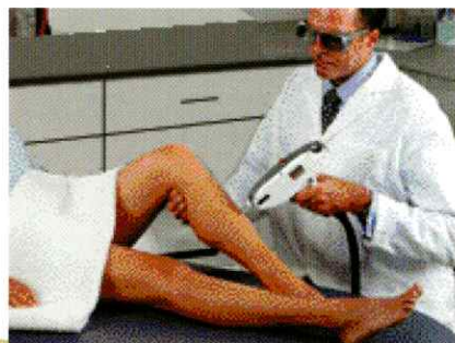
El nuevo sistema Nd:YAG IPL Quantum DL de Lumenis incorpora una pieza de mano con una vida útil de mayor duración y un enfriamiento por contacto multi-temperatura.